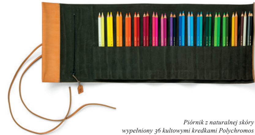
Piórnik z naturalnej skóry wypełniony 36 kultowymi kredkami Polychromos

Mała, włoska manufaktura z wielkim zaangażowaniem i pasją produkuje ze skóry naturalnej naszą kolekcję akcesoriów na biurko. Patyna, typowa dla naturalnej skóry najwyższej jakości, sprawia, że z każdym dotykem naszej dłoni produkty te nabierają osobistego charakteru. Kolekcja „Mali Giganci” oferuje możliwość luksusowego, a jednocześnie radosnego wyposażenia biurka: w trzech kieszonkach z miękkiego filcu zmieszczą się przybory do pisania, notatnik, pocztówki oraz osobiste przedmioty. Filc wyprodukowany w 100% z wysokiej jakości włoskiej wełny owczej pozbawiony jest sztucznych dodatków.